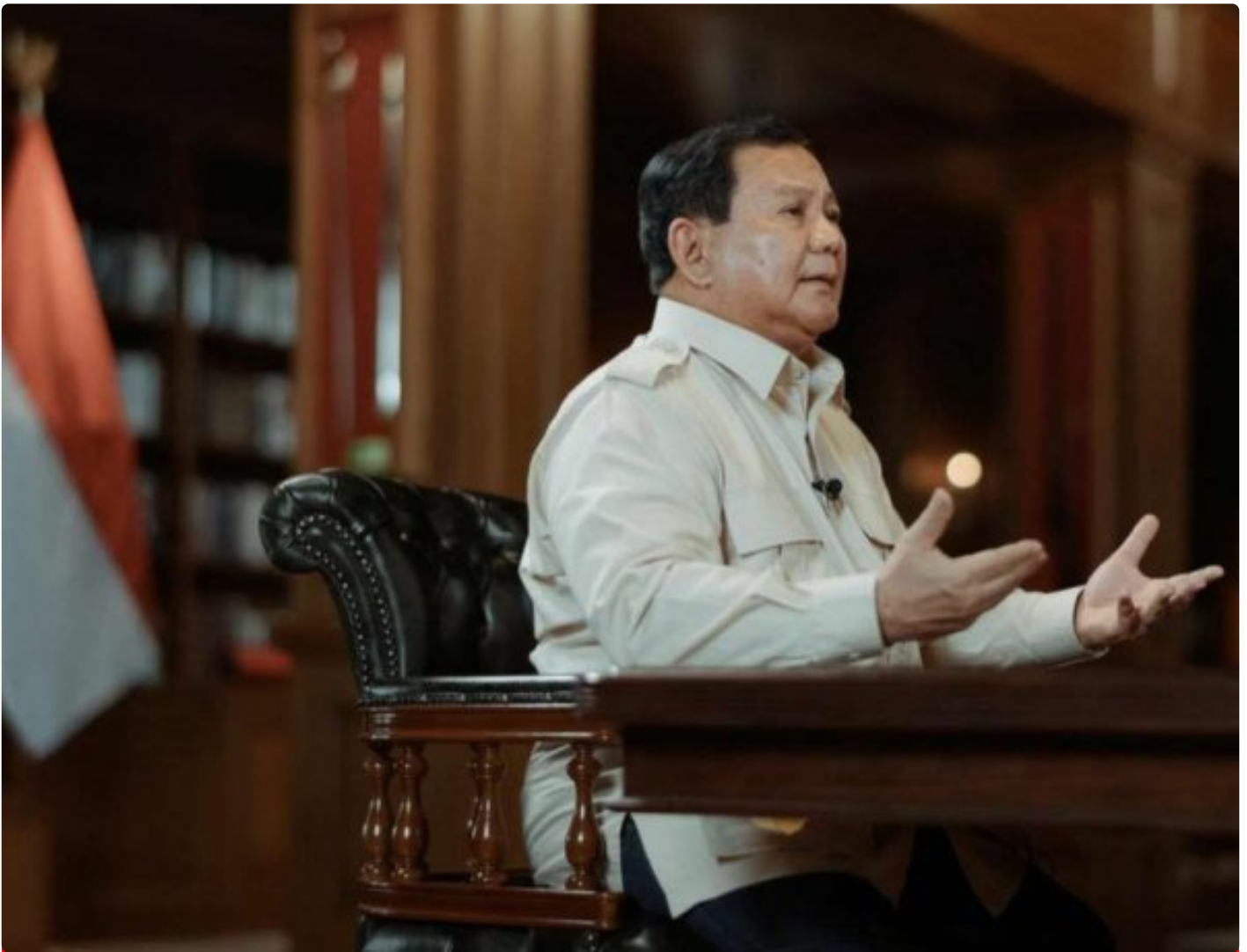
Prabowo Subianto Presiden RI 2024-2029

PENDIDIKAN - Indonesia dikenal sebagai negara yang kaya akan sumber daya alam. Dari hasil tambang yang berlimpah, laut yang luas dengan kekayaan hayati yang melimpah, hutan yang menjadi paru-paru dunia, hingga sumber daya energi yang tersebar di berbagai wilayah, semuanya menjadi kekuatan besar bagi bangsa ini. Potensi besar tersebut seharusnya dapat dimanfaatkan untuk