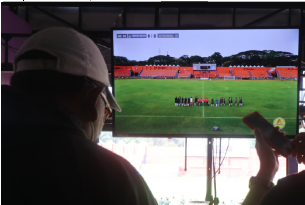
Mulai 30 April 2022 Siaran TV di 166 Kabupaten/Kota Dimatikan Senin, 17 Januari 2022 | 10:37 WIB | Oleh Elvira