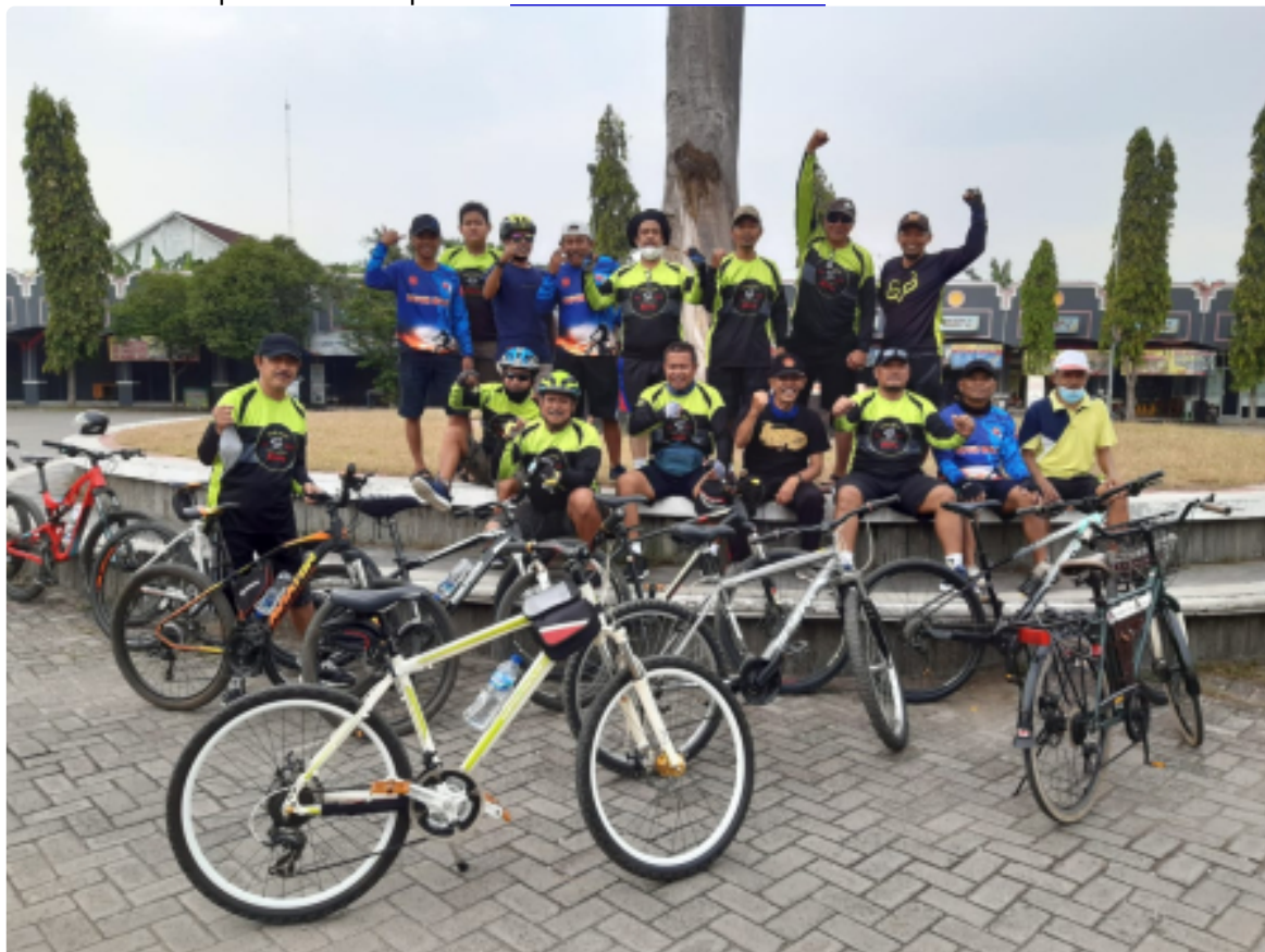
Pandemi,Komunitas Sepeda Ontel Dapur Wojo Blora Tumbuhkan Semangat Berbagi Senin, 17 Januari 2022 | 08:10 WIB | Oleh MC KAB BLORA