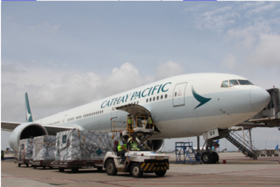
Sukseskan Vaksinasi Lanjutan, RI Terima Lima Juta Vaksin Sinovac Siang Ini Senin, 17 Januari 2022 | 14:57 WIB | Oleh Eko Budiono