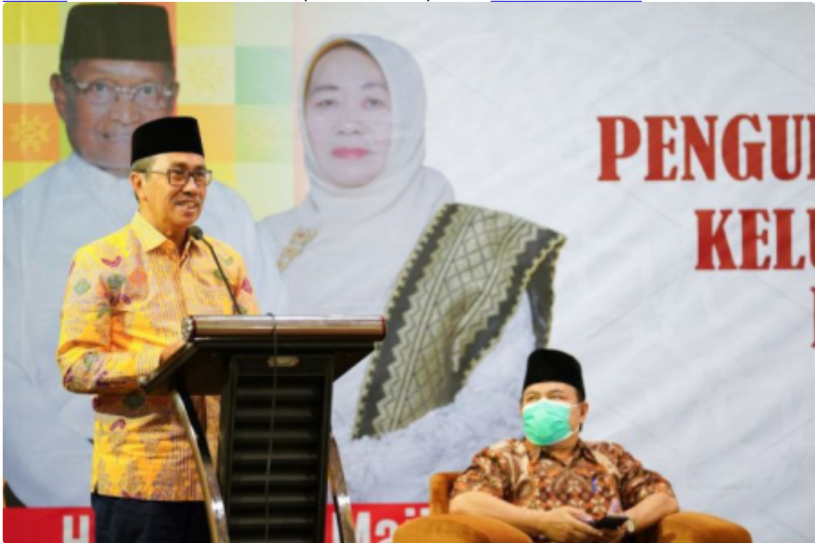
Gubernur Riau Minta Masyarakat Dukung Vaksinasi BoosterSenin, 17 Januari 2022 | 13:18 WIB | Oleh MC PROV RIAU