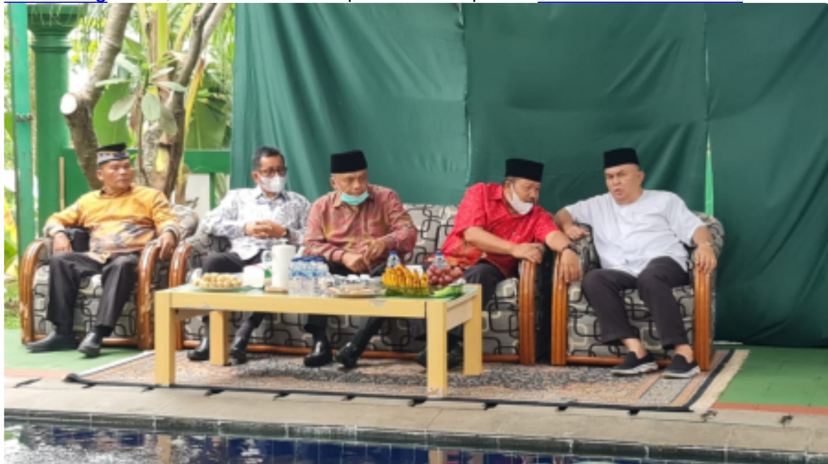
Rangkul Perantau Bangun Agama, Bupati Kunjungi IKKP Jabodetabek