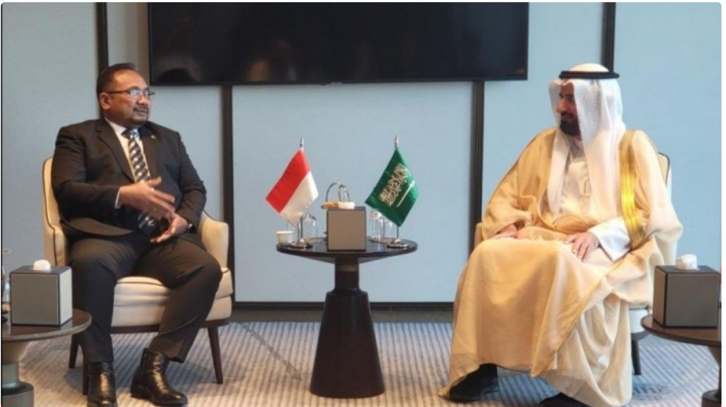
Menag Yaqut bertemu Menteri Haji Arab Saudi Tawfiq F. Al Rabiah, di Jeddah.

JAKARTA - Indonesia dan Pemerintah Kerajaan Arab Saudi telah menandatangani kesepakatan penyelenggaraan ibadah haji 1444 H/2023 M. Kesepakatan tersebut ditandatangani hari ini oleh Menag Yaqut Cholil Qoumas bersama Menteri Haji dan Umrah Arab Saudi Tawfiq F Al Rabiah di Jeddah.