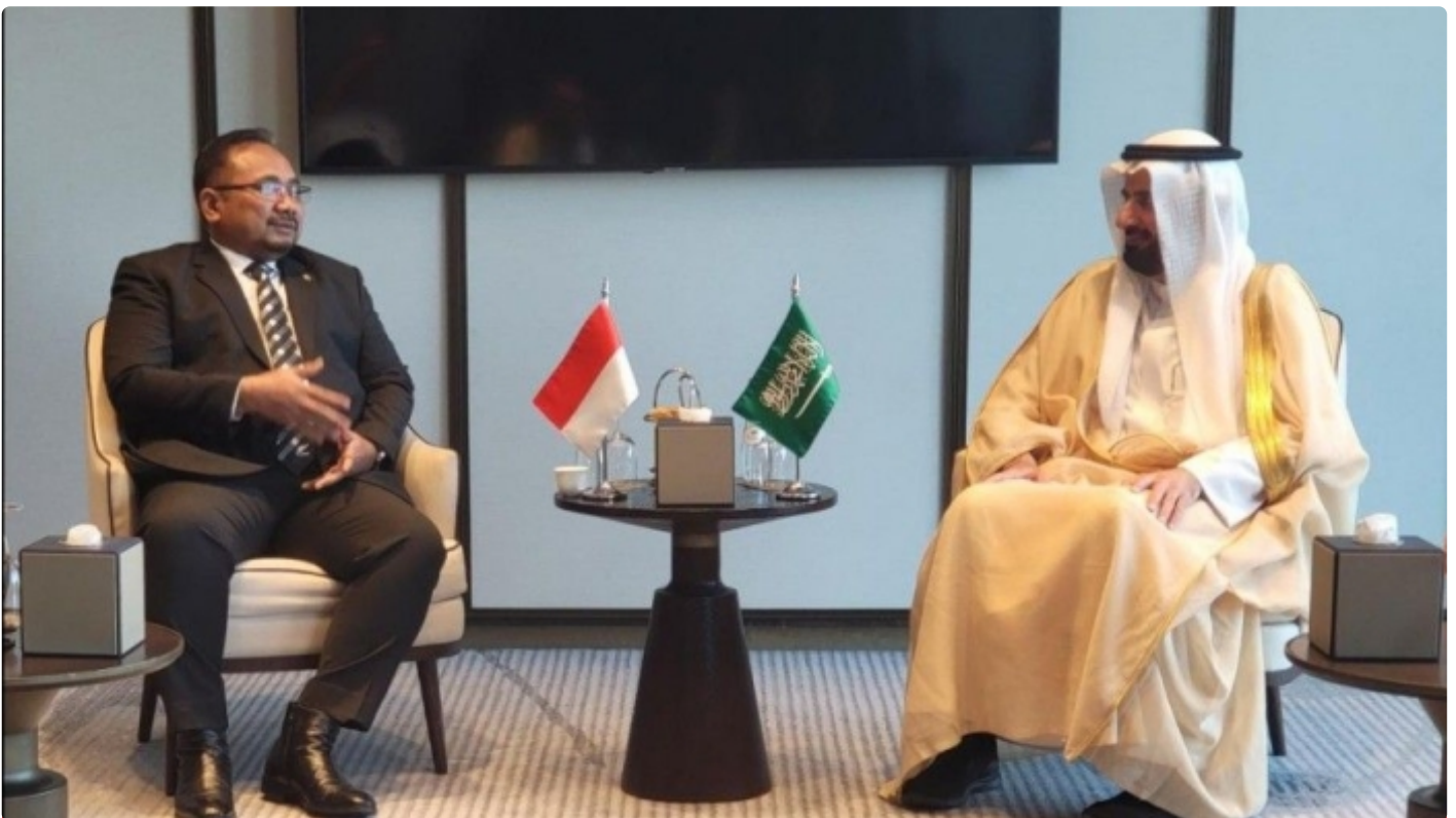
Menag Yaqut bertemu Menteri Haji Arab Saudi Tawfiq F. Al Rabiah, di Jeddah.

JAKARTA - Indonesia dan Pemerintah Kerajaan Arab Saudi telah menandatangani kesepakatan penyelenggaraan ibadah haji 1444 H/2023 M. Kesepakatan tersebut ditandatangani hari ini oleh Menag Yaqut Cholil Qoumas bersama Menteri Haji dan Umrah Arab Saudi Tawfiq F Al Rabiah di Jeddah.